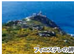
フィニステレの岬

◆利用予定航空会社:イベリア航空、エールフランス、フィンエアー、KLMオランダ航空